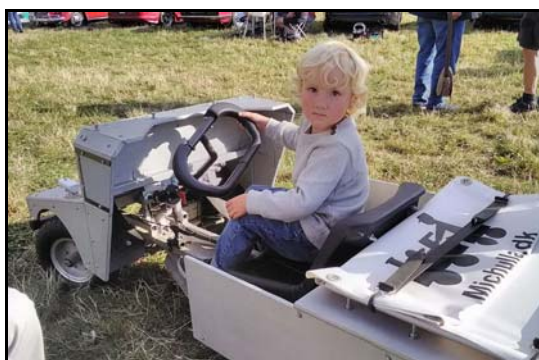
Børnene er meget begejstrede for de små biler vi har med når vi