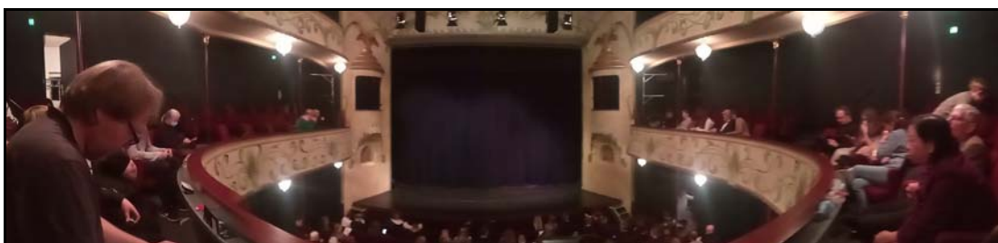
Viborg Teater Panorama fra 1. Balkon, midtfor.