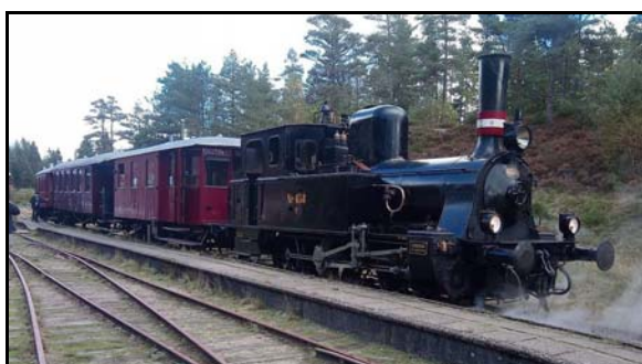
På tur med veteranbanen Bryrup-Vrads i efterårsferien.